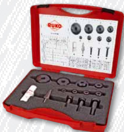
Nr. 109 003