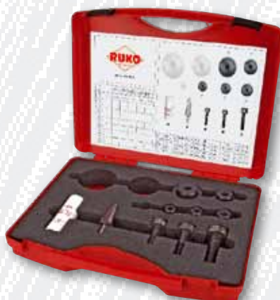
Nr. 109 006 K