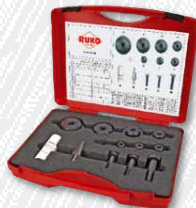
Nr. 109 008