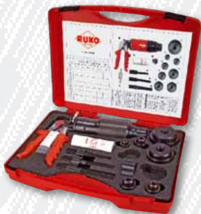
Nr. 109 009