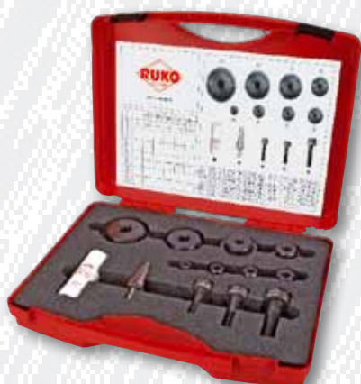
Nr. 109 003 K