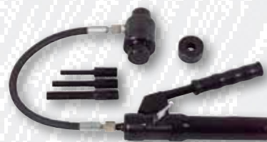
Nr. 109 201