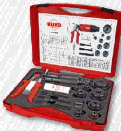
Nr. 109 004