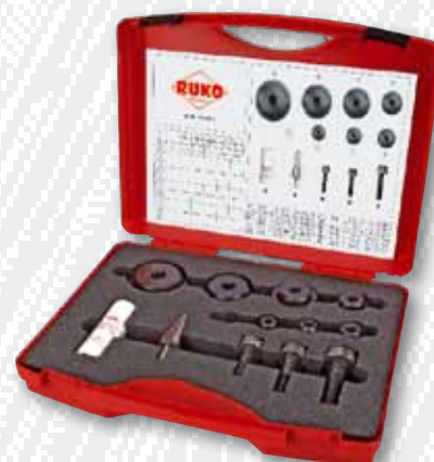
Nr. 109 008 K