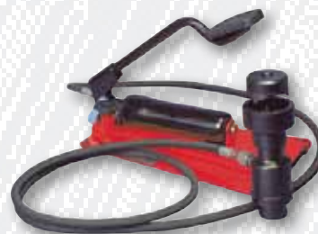
Nr. 109 301