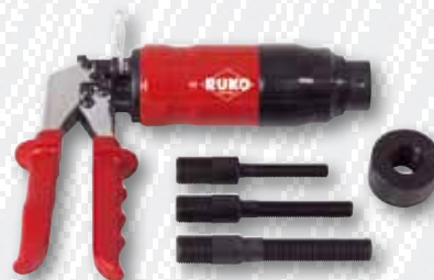
Nr. 109 101