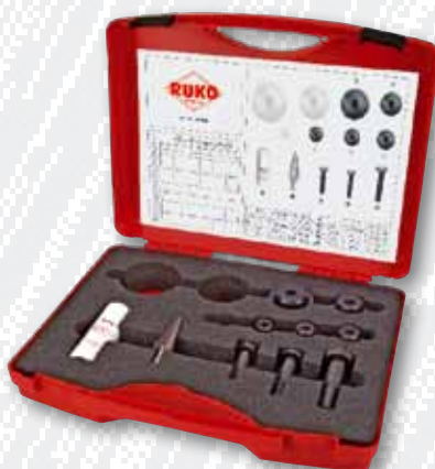
Nr. 109 006