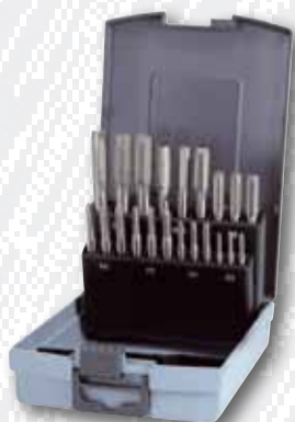
Nr. 245 001 RO