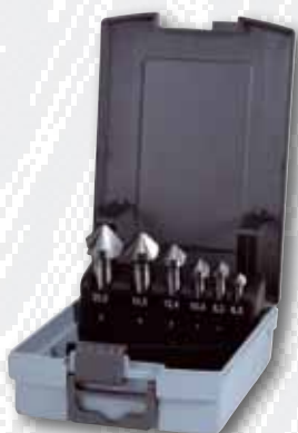
Nr. 102 152 HMRO