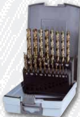
Nr. 215 214 RO