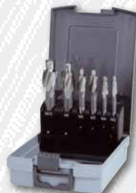
Nr. 102 452 RO