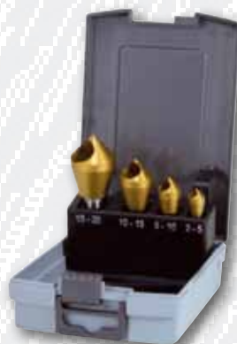
Nr. 102 312 TRO