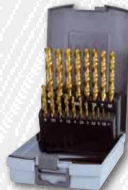
Nr. 250 214 TRO