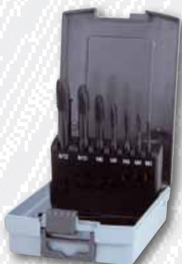
Nr. 245 063 RO