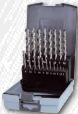
Nr. 258 214 RO