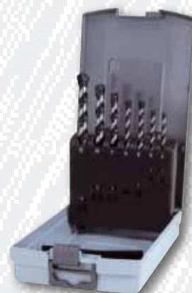
Nr. 205 255 RO