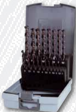
Nr. 258 214 FRO