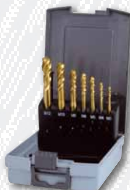
Nr. 245 066 RO