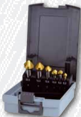
Nr. 102 152 TRO