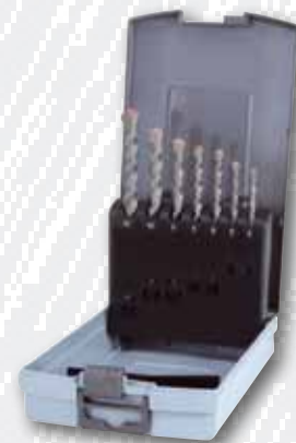
Nr. 205 256 RO