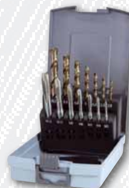
Nr. 245 051 RO