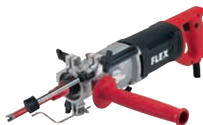
BHW 812 VV Patogi naudoti deimantinio gręžimo mašina, skirta gręžti šlapiuoju būdu Užsakymo Nr. 277.940

Standartinis komplektas: 1 lanko formos rankena · 1 veržlinis raktas, SW 17 · 1 apsauga nuo purškiamo vandens · 1 metalinis lagaminas