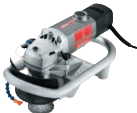
LWW 2106 VR 2 200 W granito briaunų freza Užsakymo Nr. 253.705

Standartinis komplektas: 1 nusiurbimo dangtelis · 1 lanko formos rankena · 1 gręžimo stovas su kreipiamosiomis, BD 18 · 1 siurbimo žarnos jungtis · 1 pustyklė · 1 metalinis lagaminas