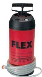
WD 10 Vandens slėginis indas 10 l Užsakymo Nr. 251.622