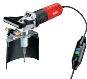
BHW 1549 VR Aklinių kiaurymių gręžimo mašina su integruota vandens tiekimo sistema Užsakymo Nr. 299.197

Standartinis komplektas: gręžimo stovas BD 06