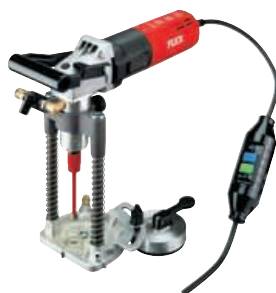
BED 18 Deimantinio gręžimo mašina ankerių angoms gręžti su integruota vandens tiekimo sistema Užsakymo Nr. 290.300

Naudojamoji galia 1 200 W Efektyvioji galia 700 W Tuščiosios eigos sūkių skaičius 3 500–10 000/min Įrankio tvirtinimo sriegis M 14 Deimantinio grąžto Ø 6–14 mm Svoris 4,1 kg