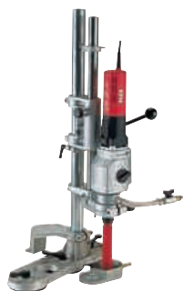
BED 55 Deimantinio gręžimo mašina su integruota vandens tiekimo sistema Užsakymo Nr. 257.081

Standartinis komplektas: 4 m slėginė žarna