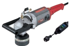
LW 1202 S 1 600 W šlapijojo šlifavimo akmens šlifuko su PRCD jungiklis, 130 mm Užsakymo Nr. 289.000