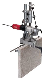
BED 69 Deimantinio gręžimo mašina angoms fasado plokščių briaunose gręžti Užsakymo Nr. 254.175

Maks. galia iki 45 min Nuolatinis veikimas 2 000 VA Matmenys (P x I x A) 200 x 200 x 270 mm Pirminė įtampa 230 V Antrinė įtampa 230 V Svoris 15,8 kg