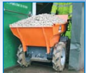
Flotacinės padangos, pritaikytos minkštam pagrindu