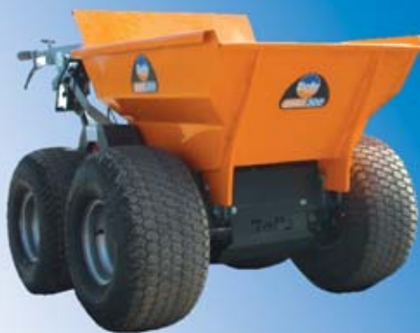
Priedai a 28